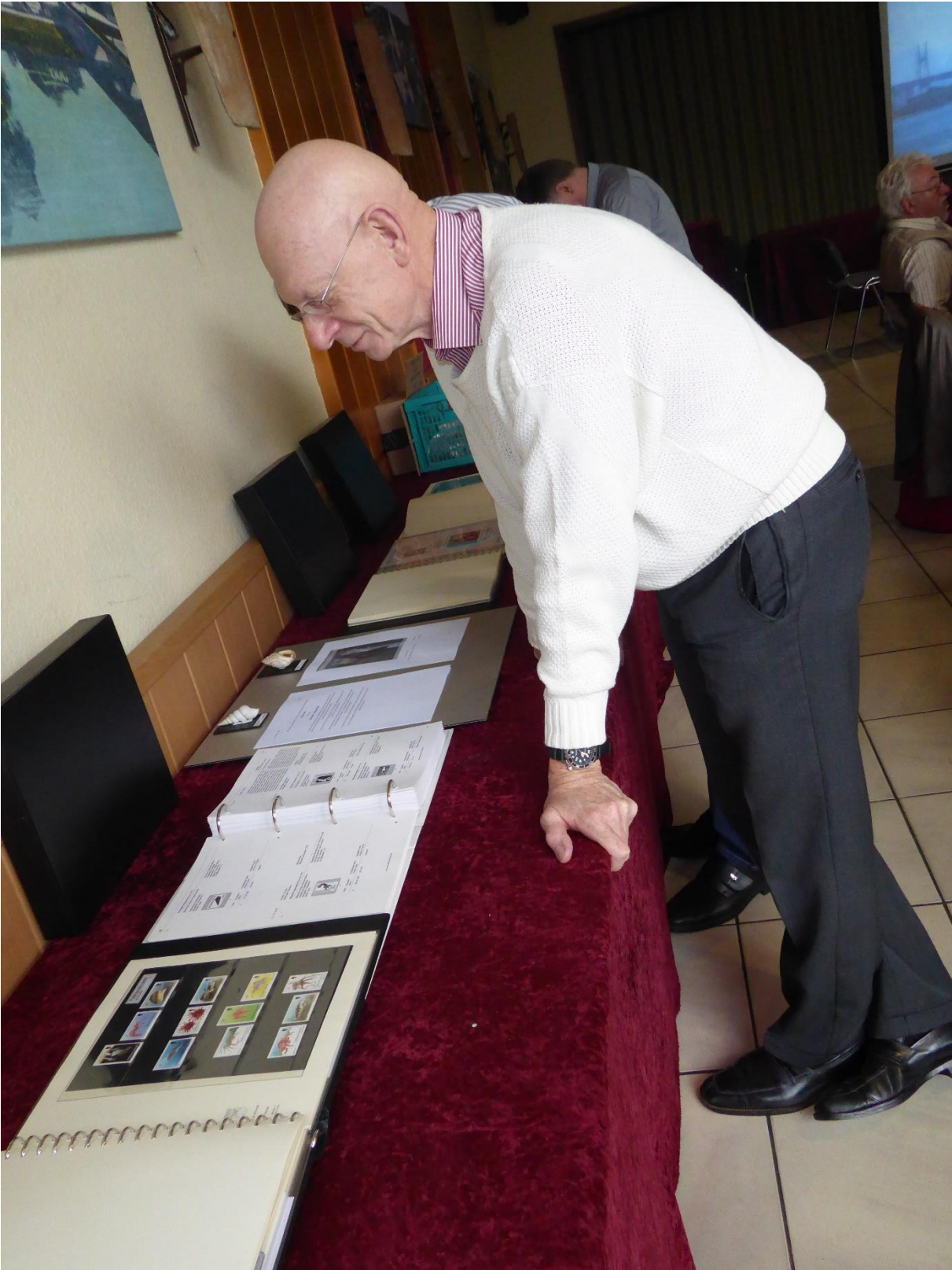
Die Alben voller Schätze