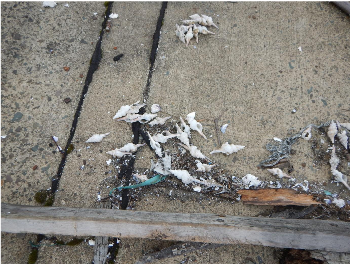
Beifang, den niemand mehr braucht – wir schon