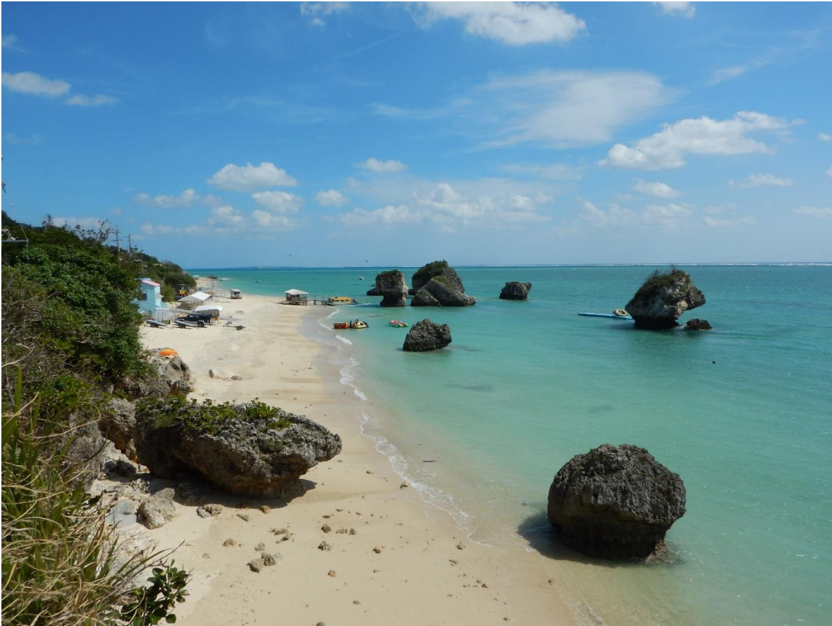
Den Besucher erwarten tolle Strände,