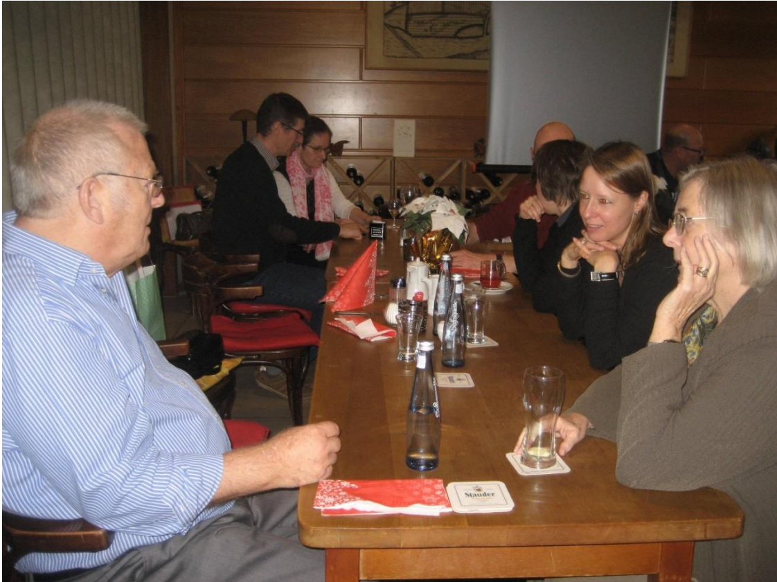
Fachgespräche in Grüppchen